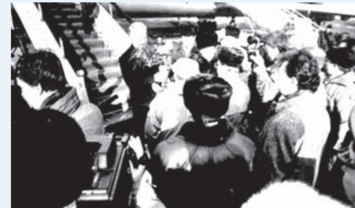
1993 год. 5 апреля. Встреча в аэропорту Братска президента России Б.Н. Ельцина.