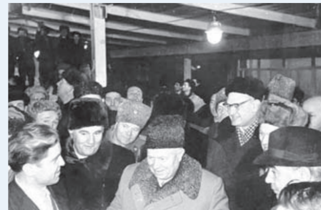
1961 год. 28 ноября. Коллектив стройки Братской ГЭС с глубокой сердечностью встретил Первого секретаря ЦК КПСС, главу советского правительства Н. С. Хрущёва. Осмотрев стройку, Никита Сергеевич направился в машинный зал и под бурные аплодисменты присутствующих повернул регулятор: первый агрегат крупнейшей в мире ГЭС включён в энергосистему и принял промышленную нагрузку.