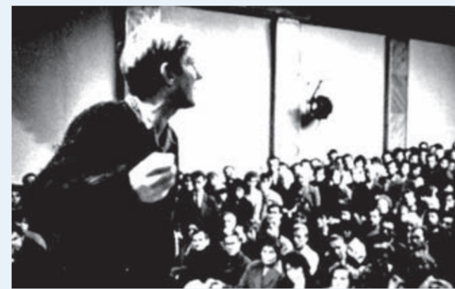
1964 год. 3 мая. В клубе «Энергетик» Евгений Евтушенко впервые прочёл «Братскую ГЭС». «Тысячная аудитория очень тепло встретила прочитанные фрагменты из новой поэмы», — писали газеты.