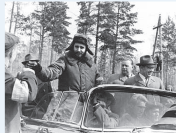
1963 год. 13 мая. Братчане встретили премьер-министра Республики Куба Фиделя Кастро и его соратников.