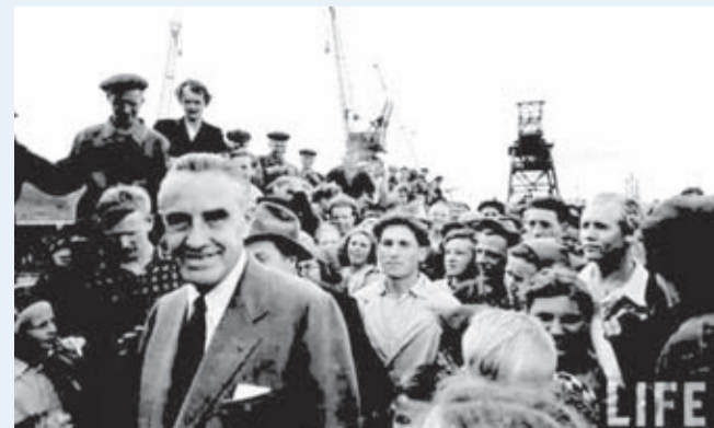
1959 год. Лето. Уильям Аверелл Гарриман — американский промышленник, государственный деятель. Был одним из ведущих американских дипломатов в отношении с Советским Союзом во время и после Второй мировой войны. Бывший посол США в СССР прилетел на перекрытие Ангары, но опоздал на ступи.

стрийский интернационалист М. Штерн, архиепископ Украинской греко-католической церкви Иосиф Сплиий, всенародно любимая певица Лидия Слушанова и многие другие. С началом строительства Братской ГЭС Братск стал меккой для политиков и бизнесменов, журналистов и художников, писателей и поэтов. Предлагаем вашему вниманию фотодокументы посещения города Братска знаменитыми людьми России и зарубежья.