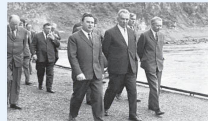
1973 год. Апрель. СССР посетил президент Мексики Луис Эчеверрия Альварес. Это был первый официальный визит главы латиноамериканского государства в нашу страну. Члены делегации Мексики посетили Иркутск, а в Братске побывали на ГЭС, встретились с рабочими Братского алюминиевого завода, побывали на лесопромышленном комплексе (БЛПК). На фото: в центре президент, слева склонился мексиканский журналист, позади — М. И. Совенко — собкорреспондент ТАСС в Братске и Л.А.Аблогин — заместитель директора Братской ГЭС по работе с иностранными гостями.