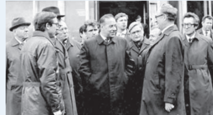
1968 год. А.Н. Косыгин — председатель Совета Министров СССР с руководителями города Братска.