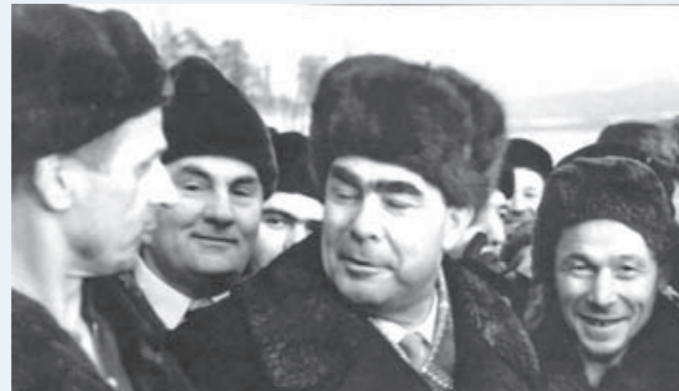
1960 год. 11 декабря. Строительство посетил член Президиума ЦК КПСС, председатель Верховного Совета СССР Л. И. Брежнев, радушно встреченный коллективом гидростроителей.