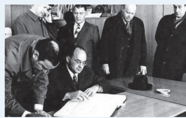
1972 год. 4-5 февраля. В гостях у братчан лётчик-космонавт-2, Герой Советского Союза Г. С. Титов. Он ознакомился с Братской ГЭС и городом, встретился с представителями трудящихся и принял участие в работе XII Братской городской отчетно-выборной комсомольской конференции, которая проходила в ДК «Лесохимик».