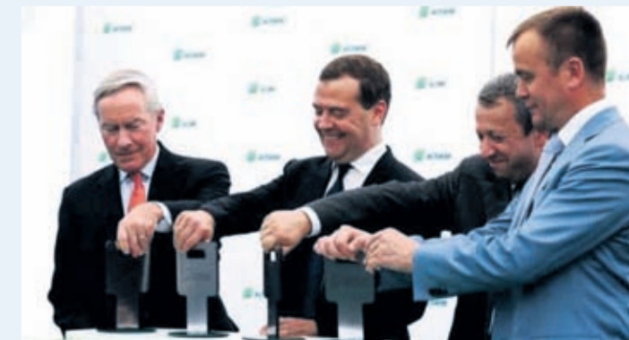
2013 год. 19 июня. Глава правительства России Дмитрий Анатольевич Медведев принял участие в церемонии запуска нового производства хвойной белёной целлюлозы ОАО «Группа «Илим» в Братске. Символическим поворотом ключа была оставлена работа БЦБК — на радость экологам Приангарья.